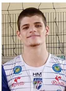
7 YAN FORESTI